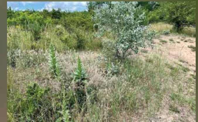
So könnte ein typisches Biotop in unserer Region aussehen.

Die Gottesanbeterin ist in Mitteleuropa auf besonders wärmebegünstigte Lebensräume beschränkt. Man findet sie zum Beispiel an lichten Waldrändern an höheren Stauden. Manchmal tauchen die Tiere auch in Gärten auf.