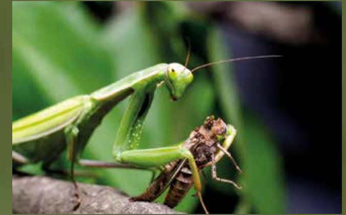
Mit den Fangbeinen hält die Gottesanbeterin ihre Beute fest – hier eine Heuschrecke.

Gottesanbeterinnen leben nur einen Sommer lang und pflanzen sich nur einmal im Leben fort. Nur die Larven überwintern und entwickeln sich im Folgejahr bis Juli oder August zum ausgewachsenen Insekt.