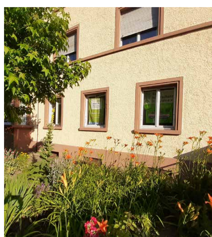
Die Geschäftsstelle ist seit den 90er Jahren an der Ecke Deschstraße und Danziger Straße