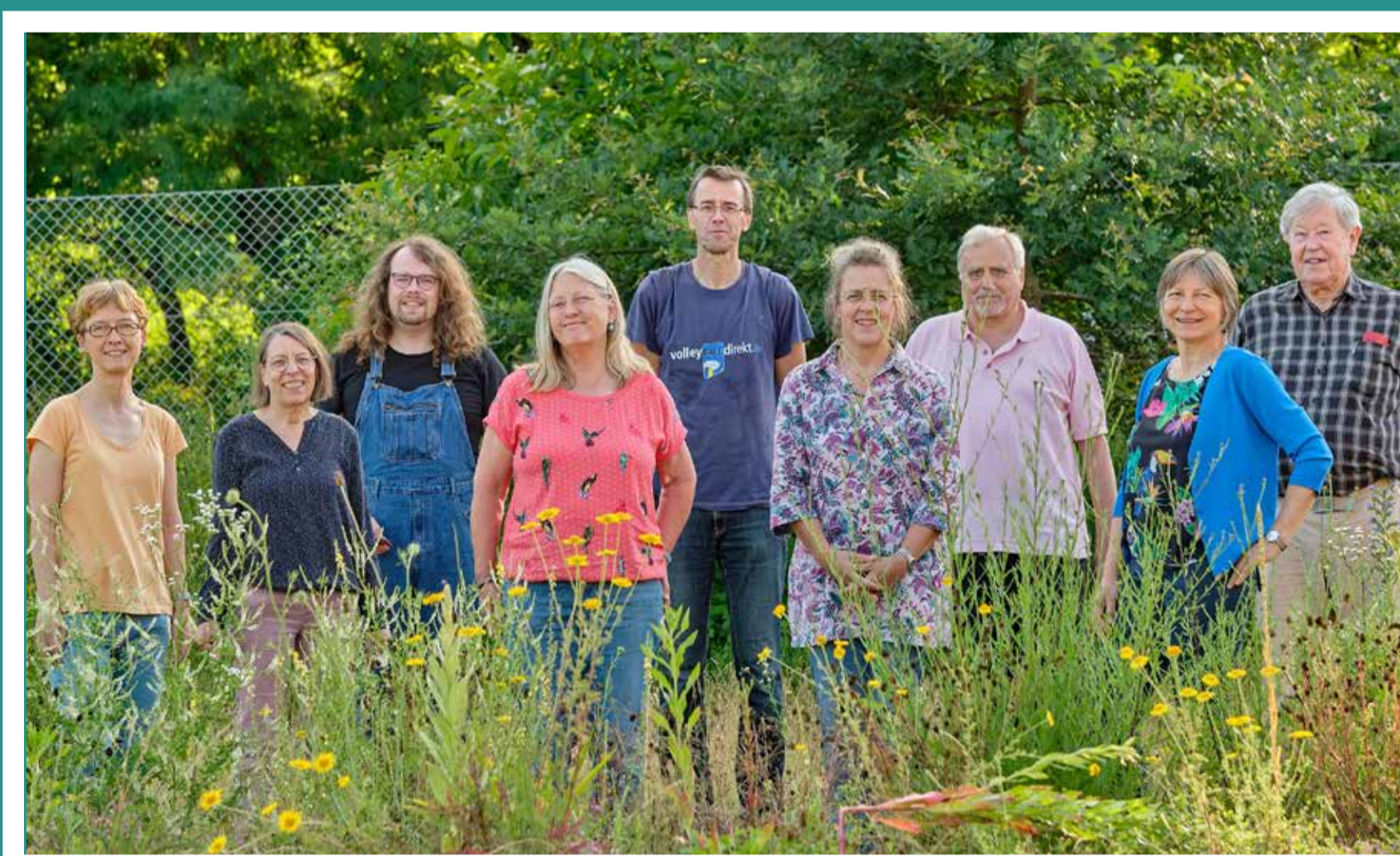
Der Vorstand der Kreisgruppe 2021 1