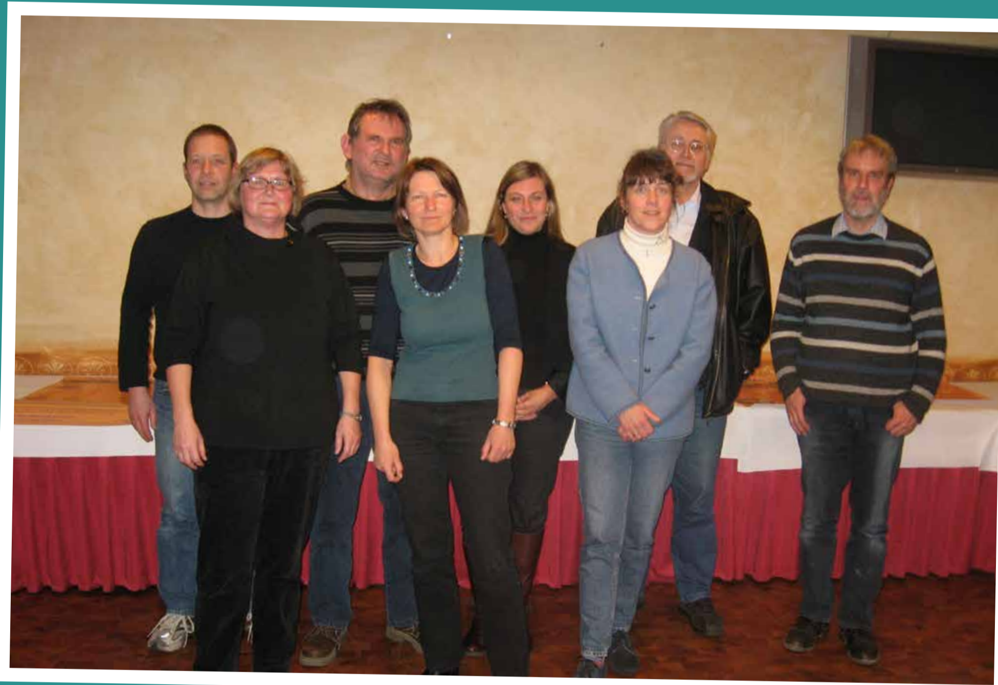
Der Vorstand der Kreisgruppe 2008