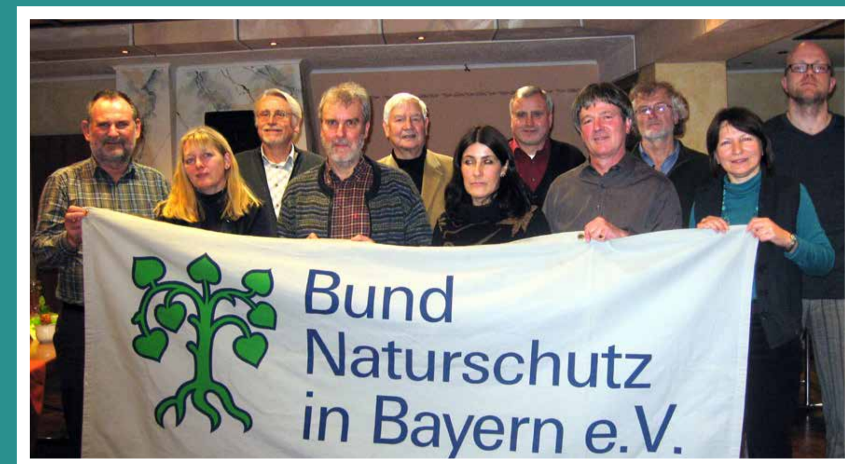
Der Vorstand der Kreisgruppe 2010