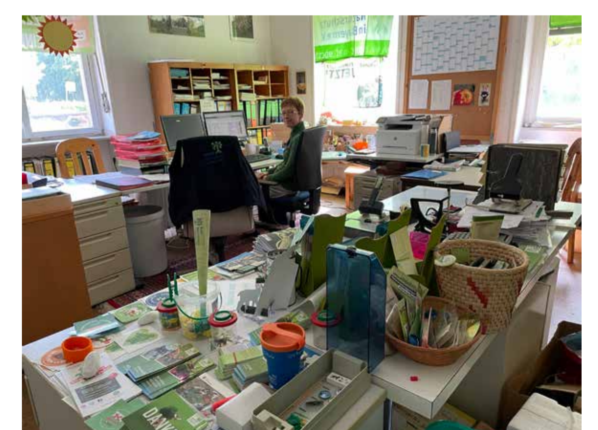
Einfach mal reinschauen - im BN Büro (2023) 3