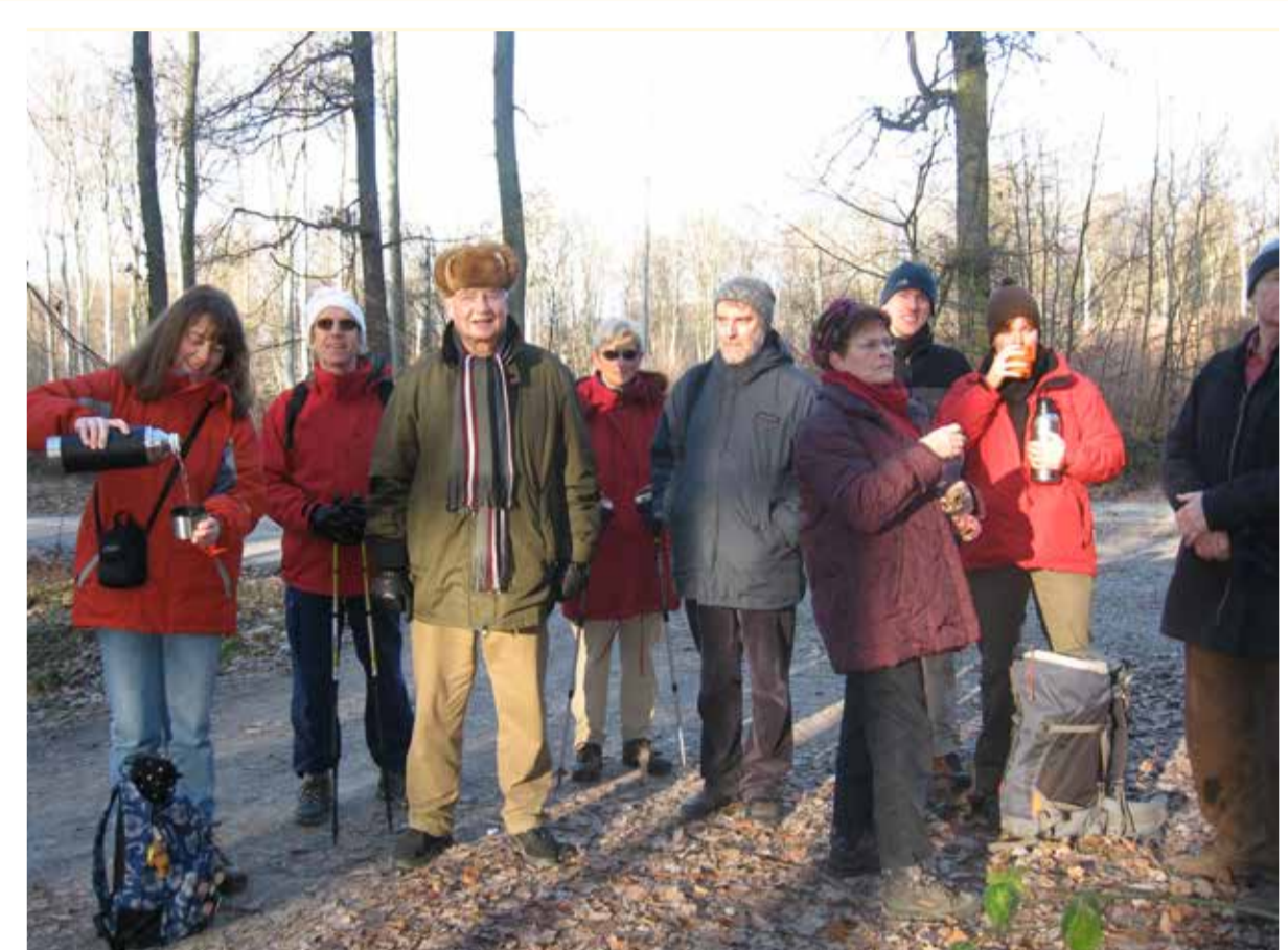
Wanderung zwischen den Jahren (2008)