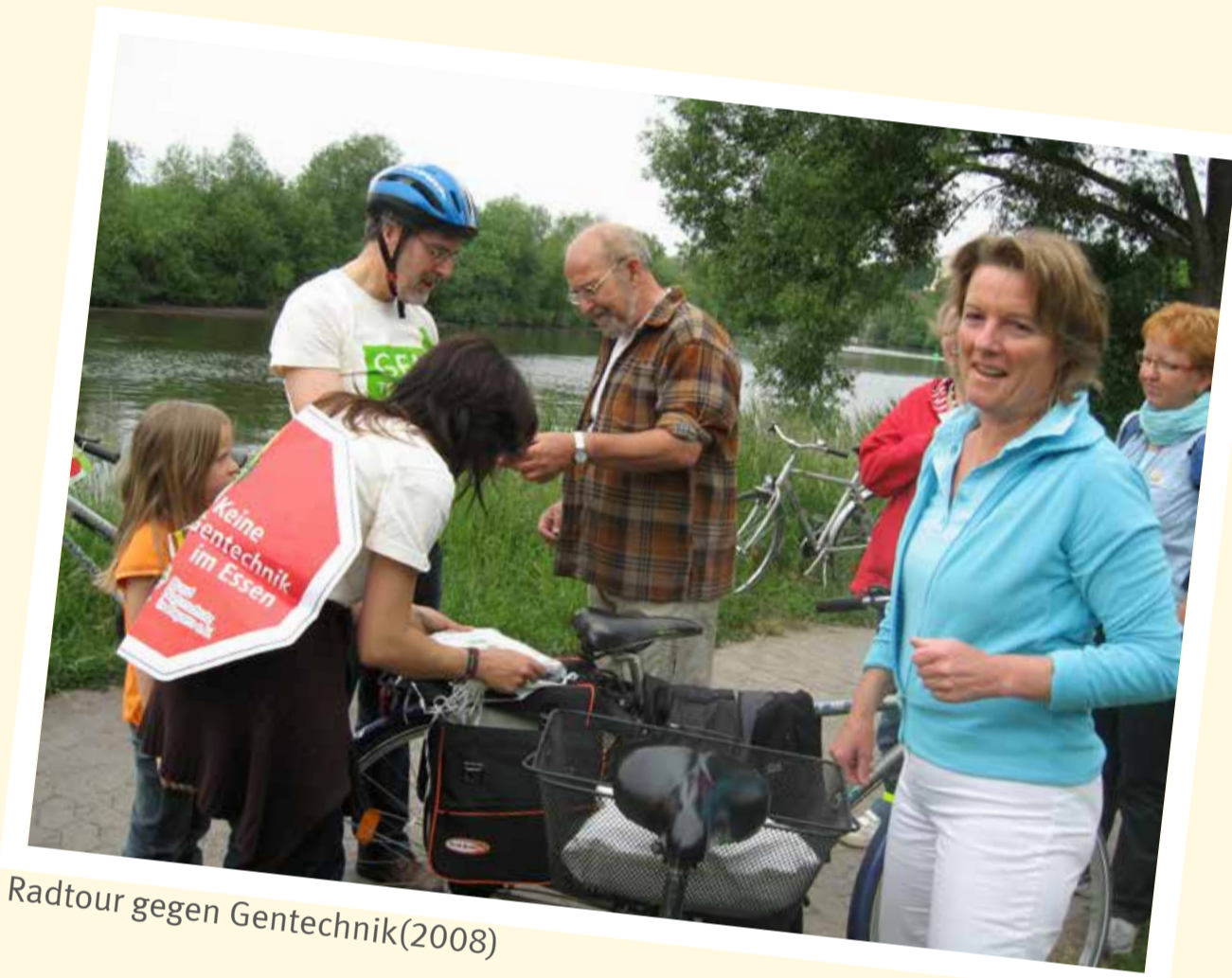
Radtour gegen Gentechnik(2008)