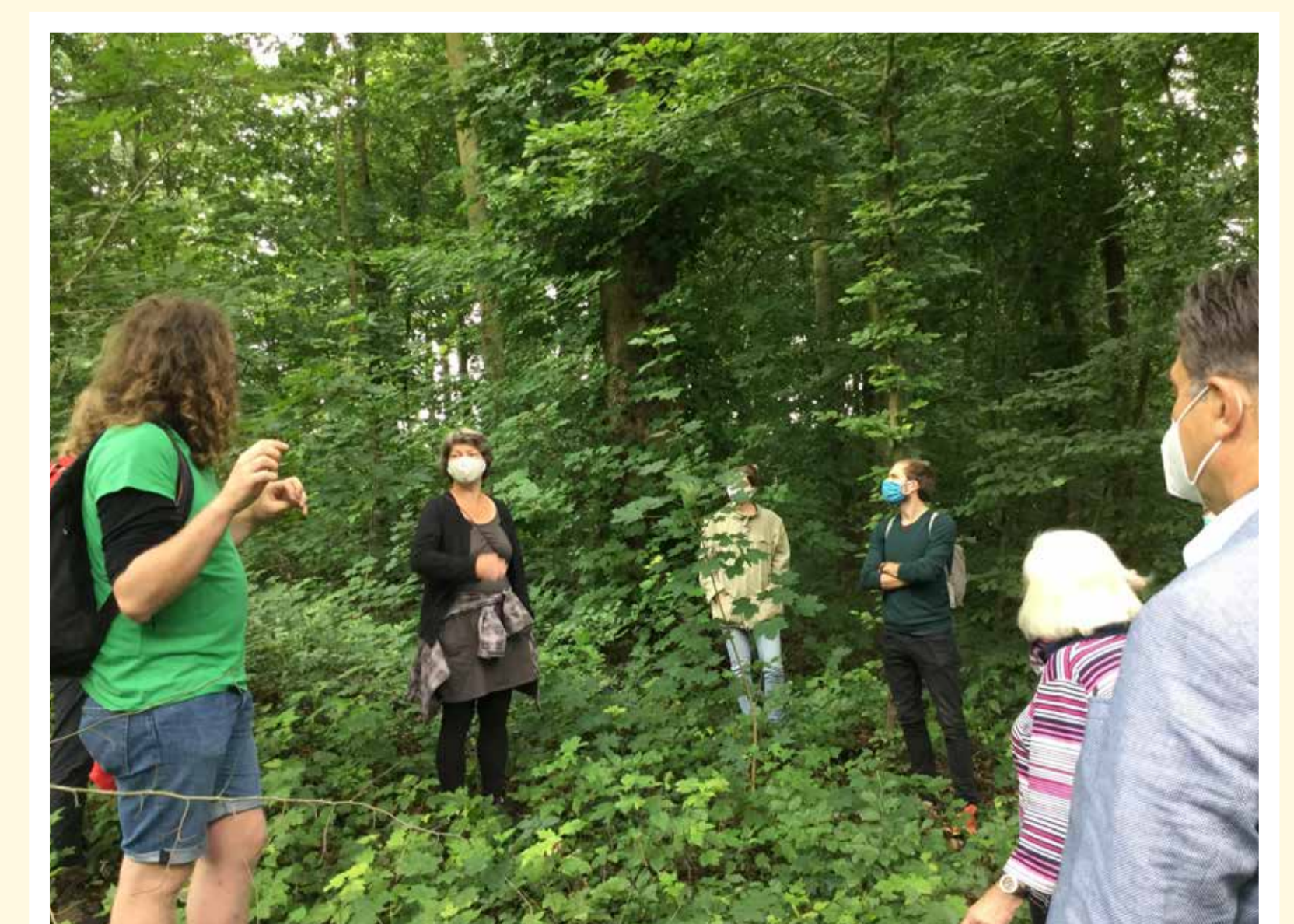
Ökologischer Stadtspaziergang der Ortsgruppe Aschaffenburg (2020)