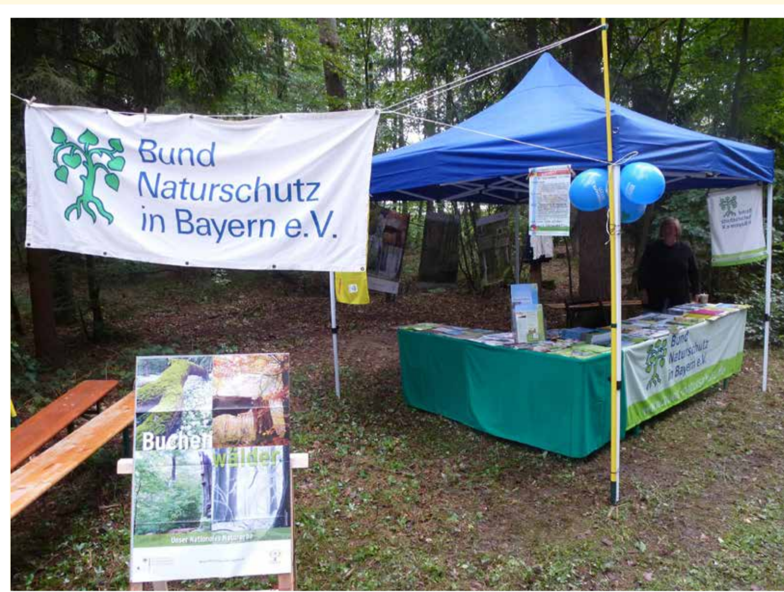
Infostand bei „Kunst am Grenzweg“ bei Großostheim (2015)