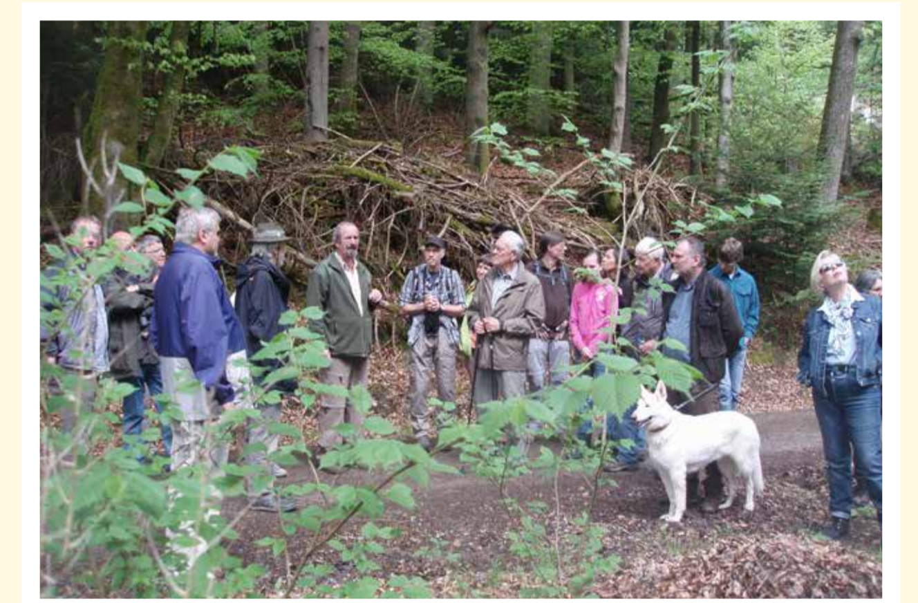
Wanderung im Kalten Grund Rothenbuch (2013)