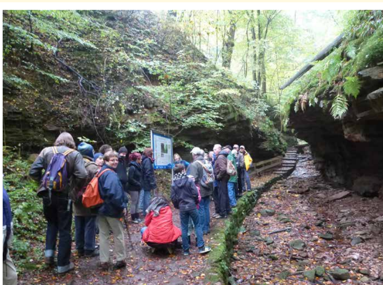
Wanderung durch die Seltenbachschlucht bei Klingenberg (2015)