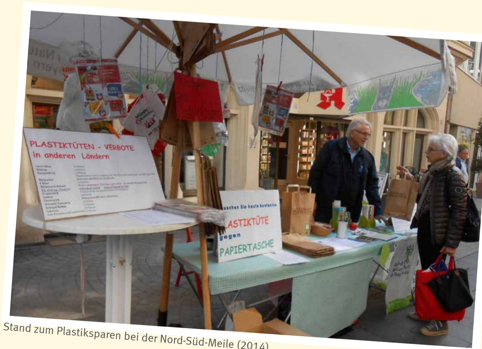
Stand zum Plastiksparen bei der Nord-Süd-Meile (2014)