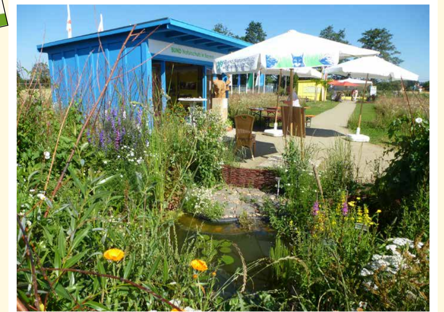
BN Pavillon mit Holzbiber auf der Landesgartenschau (2015) 1