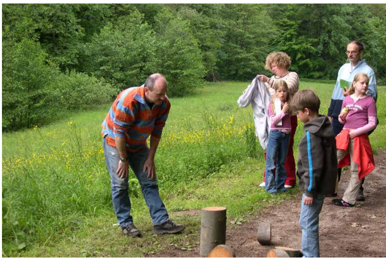
Waldabenteuer mit Baumstammuzzle (2006)