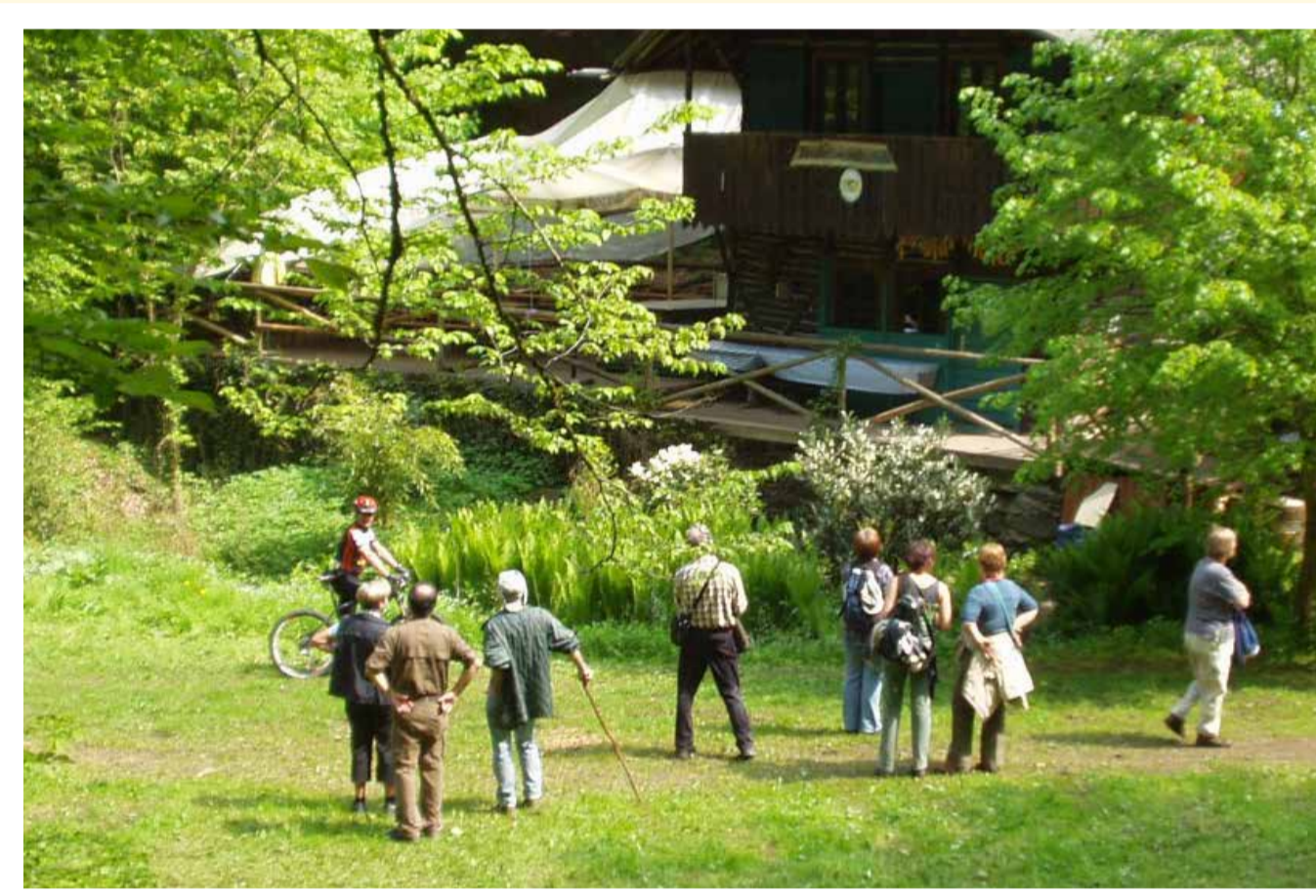
Wanderung zur Teufelsmühle im Kahlgrund (2009)